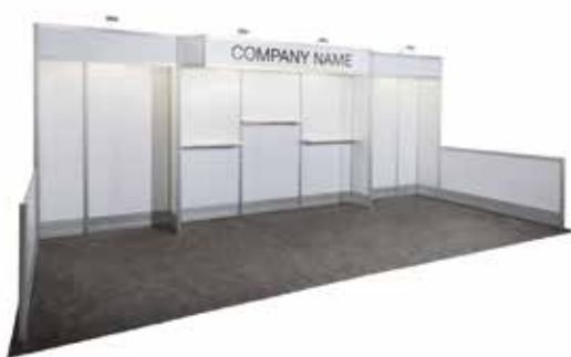
10' X 20'