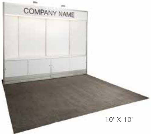
10' X 10'