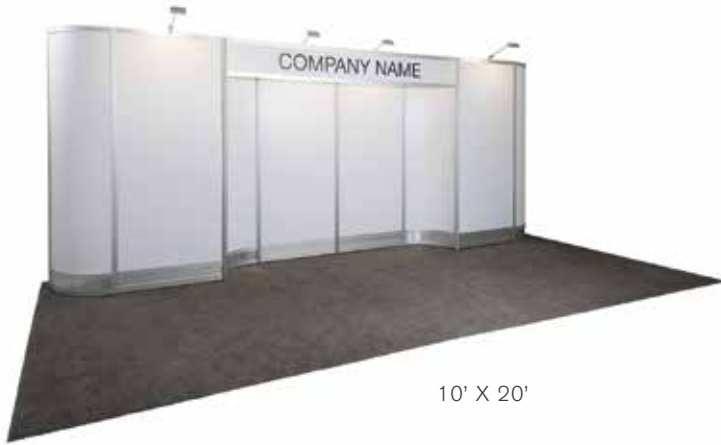
10' X 20'