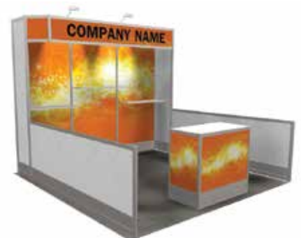
10' X 10'