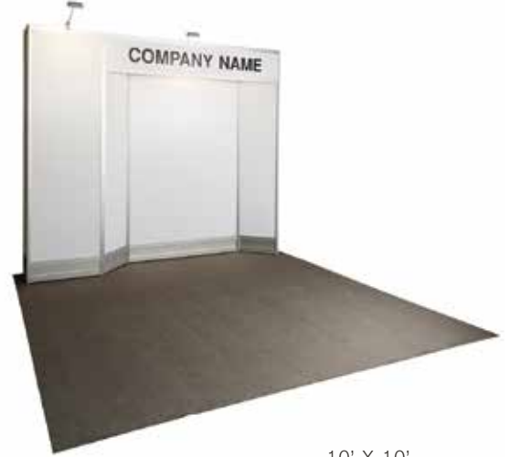
10' X 10'