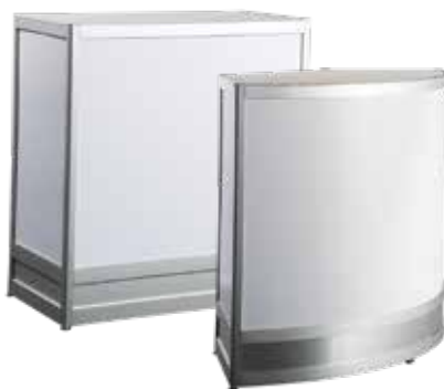
CABINETS | CABINETS