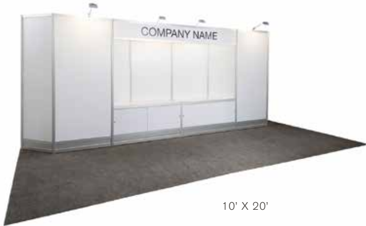
10' X 20'