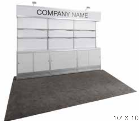
10' X 10'