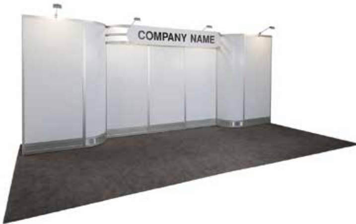
10' X 20'