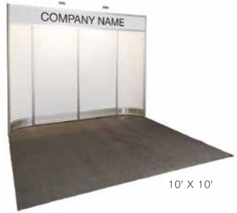
10' X 10'