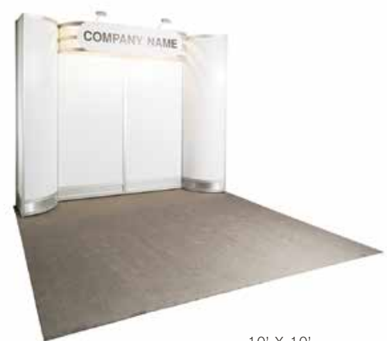
10' X 10'