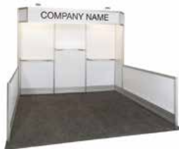
10' X 10'