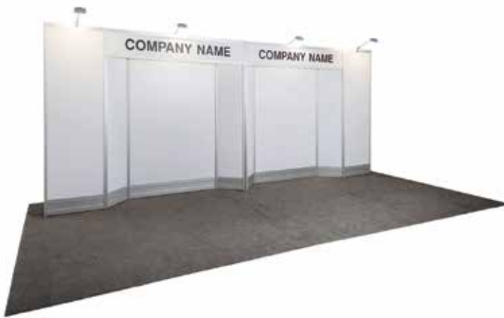
10' X 20'