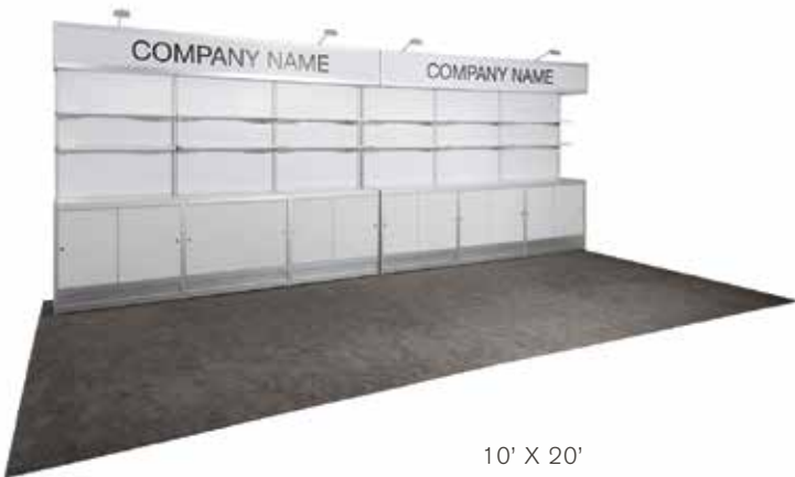
10' X 20'